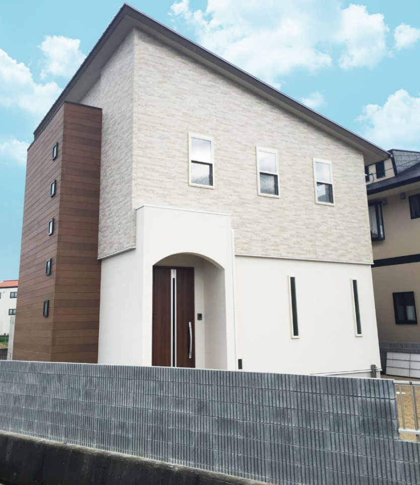
お客様の要望を実現した「洋風×モダン」の住まい。屋根には10kWの太陽光発電設備を搭載。