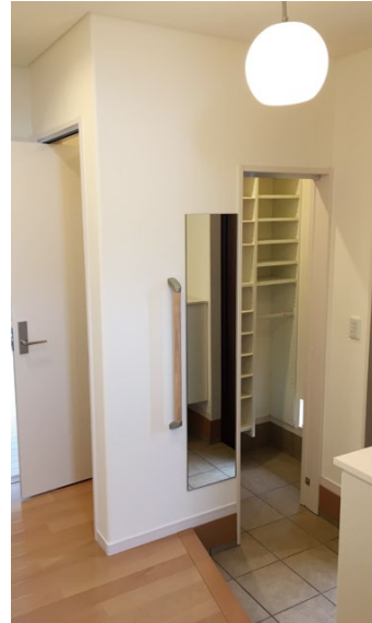
大容量の土間収納で玄関ホールをいつもスッキリと。