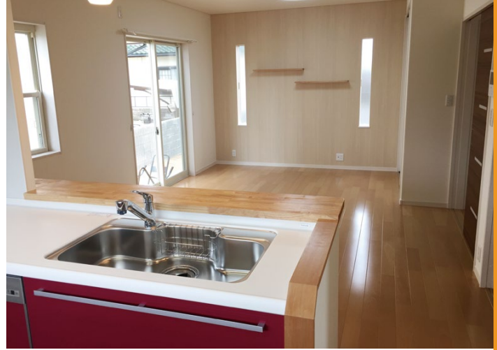
木のやさしい雰囲気にキッチンの赤色をワンポイントに加えたLDK。