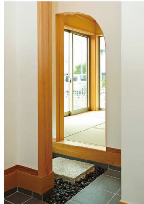
玄関から直接出入りできる和室。