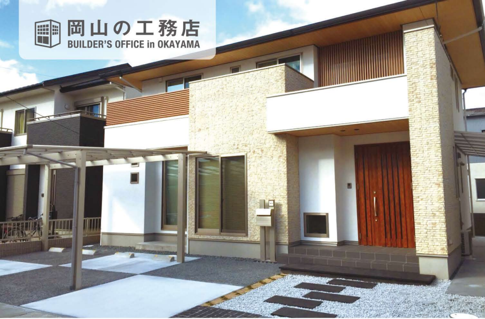
「タイル」と「格子」と大きくはね出した「軒」がバランスよく融合した、趣のある外観。