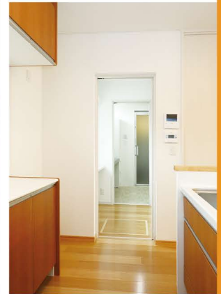
家事動線が一直線につながる機能的な配置。