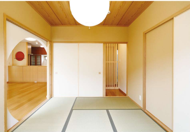
格子戸を採用することで、圧迫感がなく和の情緒溢れる落ち着いた空間を実現。