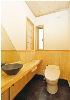
無垢の一枚板と陶器の手洗い器が優雅な空間を演出。