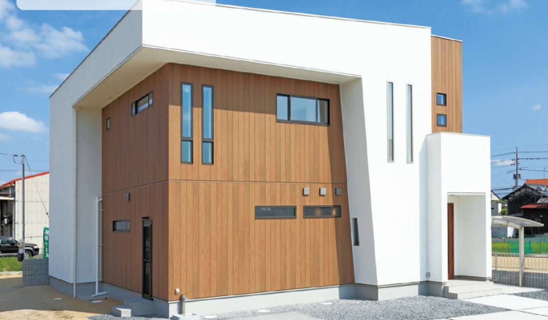
木目と白壁のコントラストに斜めラインを加えることで、より立体的に直線美を際立たせている。(NICHIIHA SIDING AWARD 2014 ニチハ賞受賞)