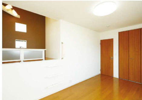
ロフトを設け、部屋の中にあるもう一つの「プライベート空間」。