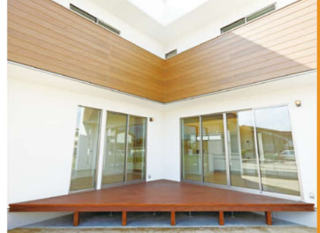
プライバシー・採光・風通しにも配慮された後面L字型空間。