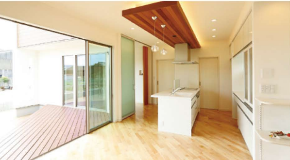
無垢床材とウッドデッキの向きを統一し、「内」と「外」の一体感を強めている。