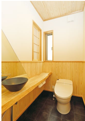
無垢の一枚板と陶器の手洗い器が優雅な空間を演出。