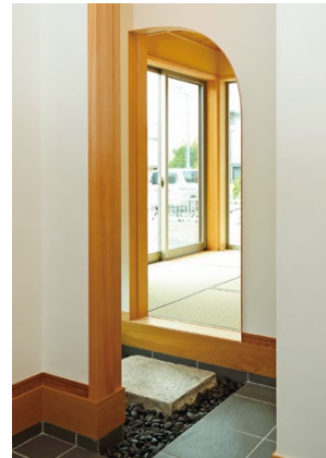
玄関から直接出入りできる和室。