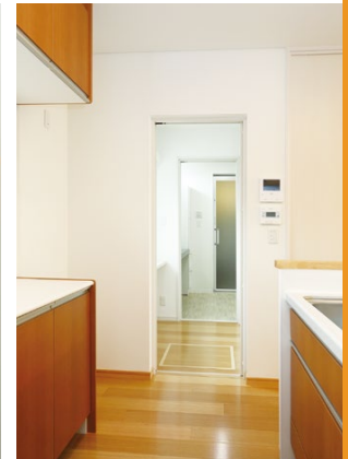
家事動線が一直線でつながる機能的な配置。