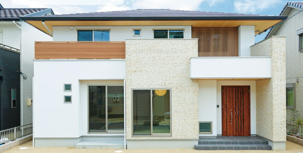
「タイル」と「格子」と大きくはね出した「軒」がバランスよく融合した、趣のある外観。