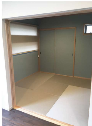
LDKと玄関ホールに隣接する和室。