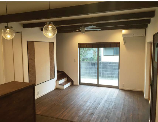
無垢の床材と化粧梁がどこかノスタルジックな雰囲気を醸し出すLDK。