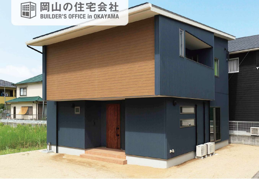
ネイビーと木目のブラウンがバランスよく融合するモダンな外観。片流れの屋根には10kWの太陽光発電設備も搭載。