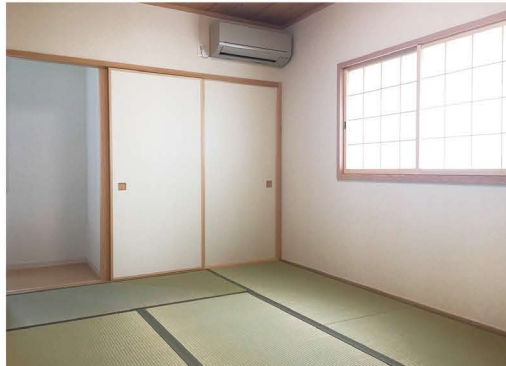
玄関ホールとLDKのどちらからも出入りでき、客間としての機能も持つ和室。