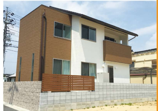
隣地との境界にはプライバシーを考慮し、木目の目隠しフェンスを設置。