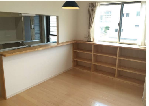
ダイニングには読書好きなご夫婦のための本棚を造作。