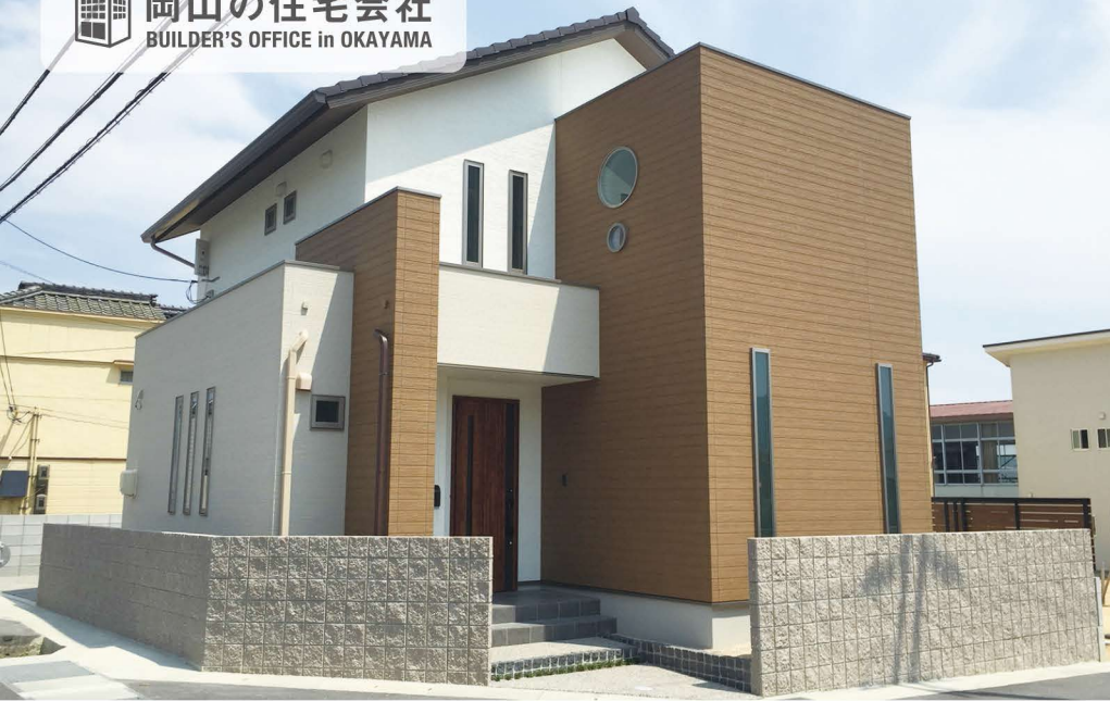
白とベージュを基調とした外壁に、木目のブラウンと丸窓をアクセントとして採用。機能性とデザイン性を兼ね備えた認定低炭素住宅。