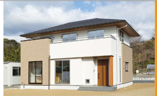
大きく張り出した木目の軒が印象的な南側外観。