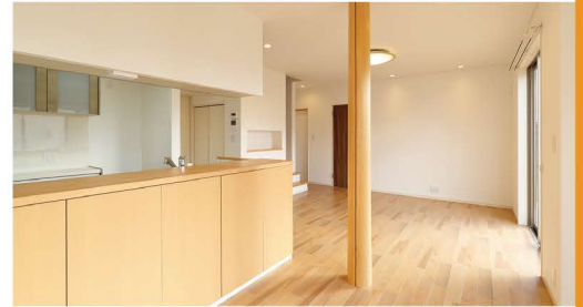
ダイニングスペースには、キッチンカウンター下を利用した大容量の扉付き収納棚を設置。