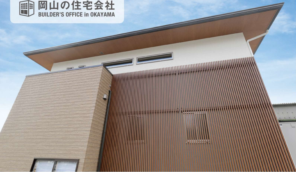
壁一面に設置した木目の縦格子がアクセント効果とプライバシー確保の二役を担う和モダンな外観。