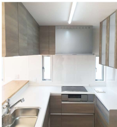
コの字型のキッチンは収納たっぷり。ダストシュートも完備。