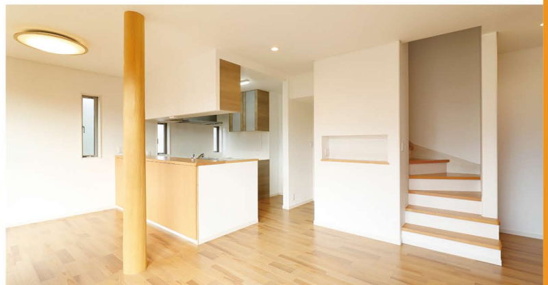
アクセントにもなる丸太の一本柱がリビングスペースとダイニングスペースを緩やかに分けるLDK。