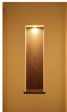
各所にあるニッチで空間に遊び心をプラス。