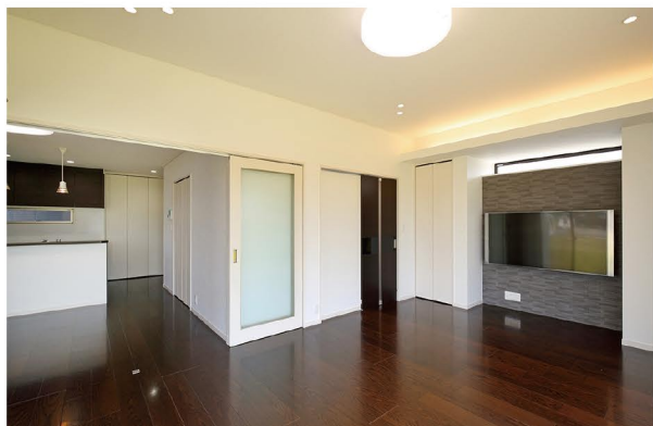
天井高2.7mの広々としたリビングとL字につながるダイニングキッチン。間仕切りで独立した空間使用も可能。