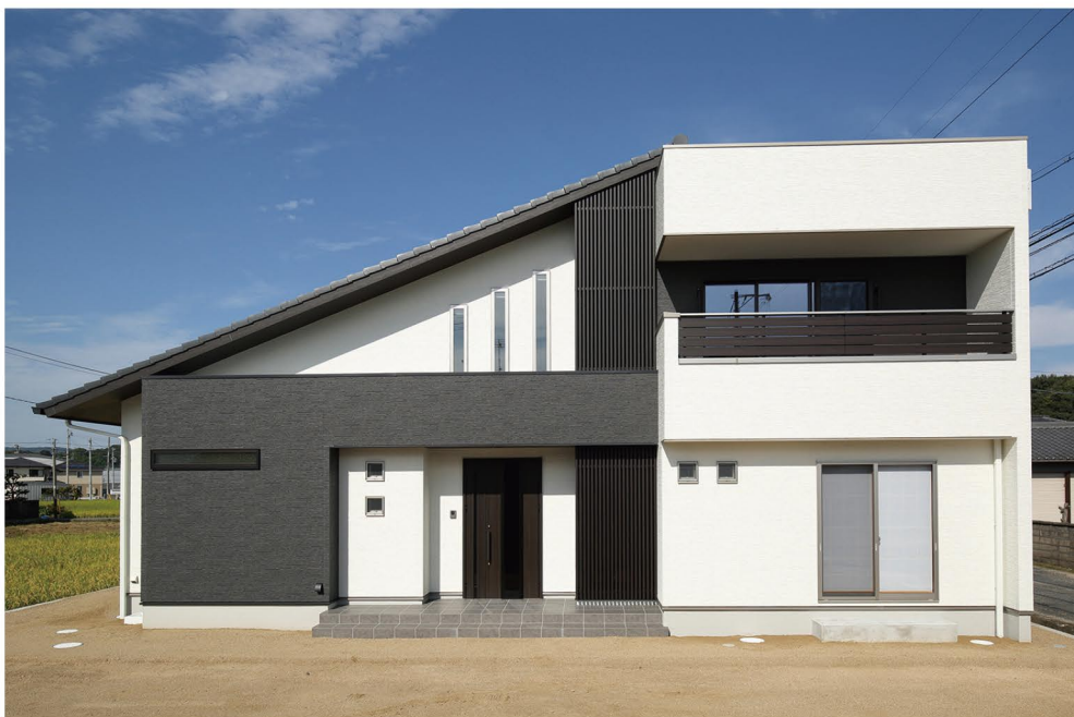
斜めと直のラインをバランスよく組み合わせた和モダンな外観。屋根には10kWの太陽光発電設備も設置。