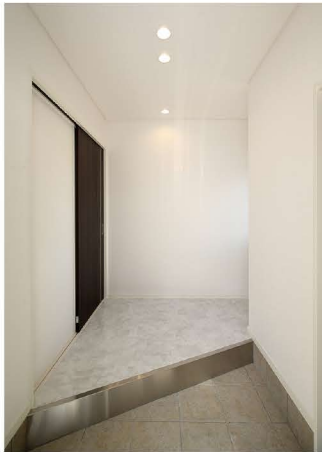
土間収納も完備した玄関ホール。