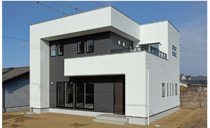
直線的なLのラインがデザイン性を高め、動のリズムを生むモダンな外観。