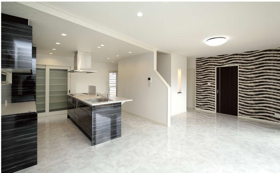
白い鏡面のフロアタイルが、スッキリと広く明るく日々の生活を演出するL型LDK空間。