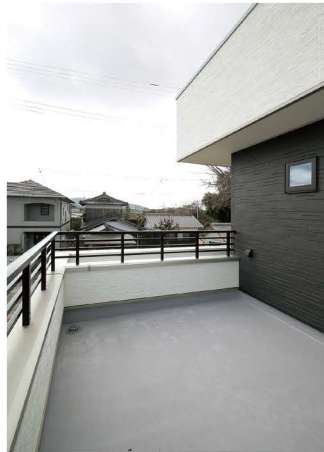
家族や友人とBBQを楽しめる広々バルコニー。