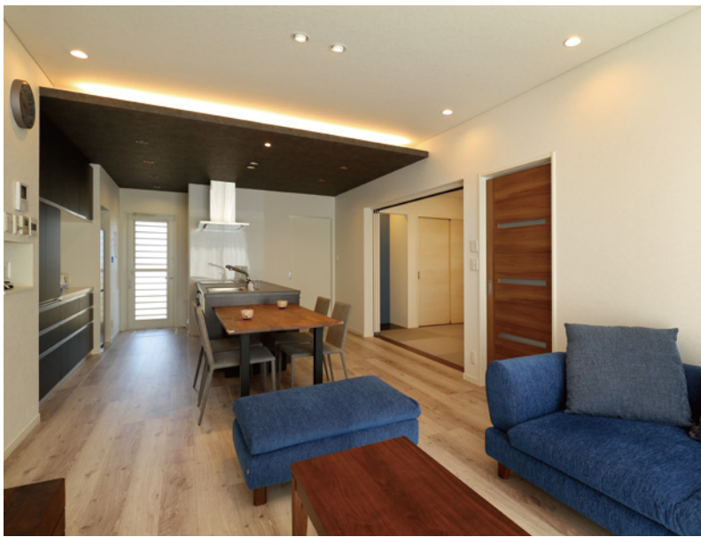
モダンでオシャレなLDK。隣接する和室は普段は開放して一体的に利用。