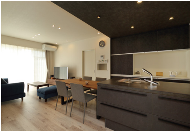
超高気密・高断熱・制震ダンパー・床暖房も完備されたデザインと性能を兼ね備えた住まい。