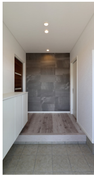
正面タイルをアクセントにした玄関ホール。