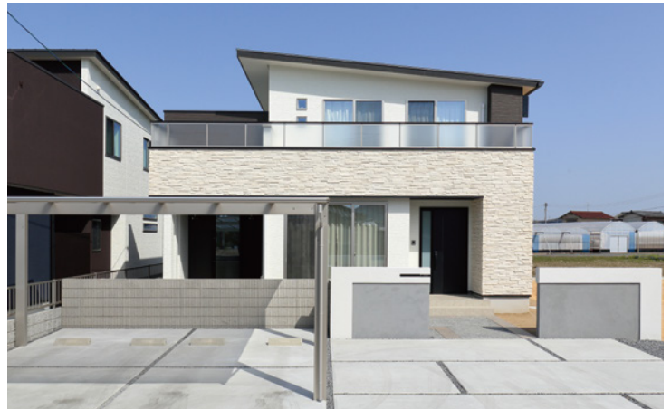
L型に張られた外壁タイルとバルコニーのスクリーンが存在感と高級感を放つモダンな外観。